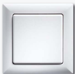
Funktaster mit Wippe