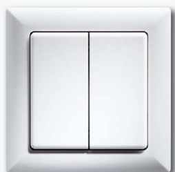
Funktaster mit Doppelwippe

Funktaster, 80x80 mm außen, Rahmen-Innenmaß 55x55 mm, 15 mm hoch. Erzeugt die Energie für Funktelegramme selbst bei Tastendruck, daher ohne Anschlussleitung und kein Stand-by-Verlust.